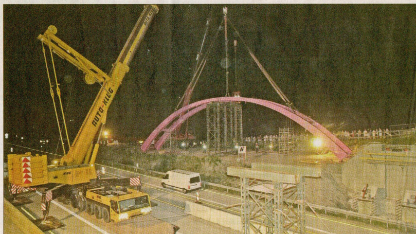
Die Brücke schwebt 0.45 Uhr ein...

23 Uhr. Noch rollt der Verkehr. Auto- und Lkw-Fahrer hupen und winken. 74 Tonnen wiegt die Stahlkonstruktion, die den Geh- und Radweg trägt. Die Kosten: 710.000 Euro. Junge Menschen und ältere stehen am Rand der Autobahn und beobachten das Treiben. Sie reden über vieles: die Tour de France, den bevorstehenden Urlaub. Hier und da gähnt jemand. „Wie kann man bloß