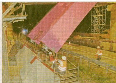
... wird zentimeterweise hinabgelassen und gesichert, bis...

4 Uhr. Der Bogen steht und ist gesichert, und die Arbeiter stoßen miteinander an. Als die Monteure ihre Arbeit beenden, ist es bereits wieder hell. Wenige Stunden später an diesem Morgen sehen die Spaziergänger und Radfahrer, die neu-