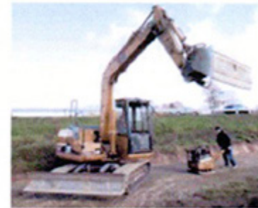
Die Bagger sind schon da. Die Straßenbauer von Eurovia, ehemals Sutter Radeberg, richten die Baustelle an der Brücke zwischen Stolpen und Langenwolmsdorf ein.

Im ersten Bauabschnitt muss für das neue Stahlbetonrohr, welches in den vorhandenen Steindeckerdurchlass eingebaut wird, die Fahrbahn im Bereich der Baustelle bis 9. Dezember einseitig gesperrt werden. Eine Ampelanlage soll derweil den Verkehr regeln.