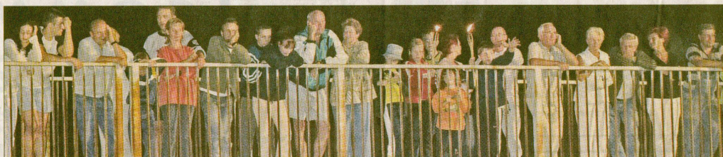
Und von der alten, rostigen Brücke schauen die Stollberger Nachtschwärmer zu.

Ende des Jahres, schätzt der Dresdener Oberbauerleiter Jörg Männle, wird es noch dauern, bis die Brücke komplett fertig ist.